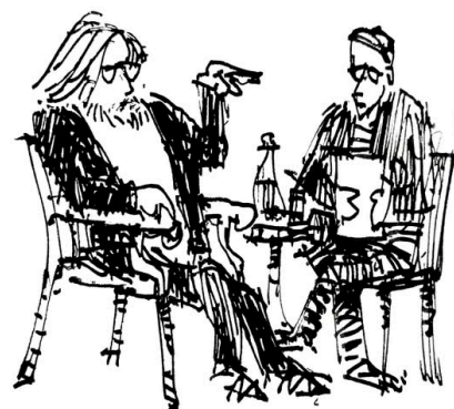
Teckning av Gunnar Lidén

Skidåkning då? I boken står snö och skidåkning utför för allt vars existens är hotat av ändrade förutsättningar. I samtalet fanns en liten spänning mellan slalomälskaren och