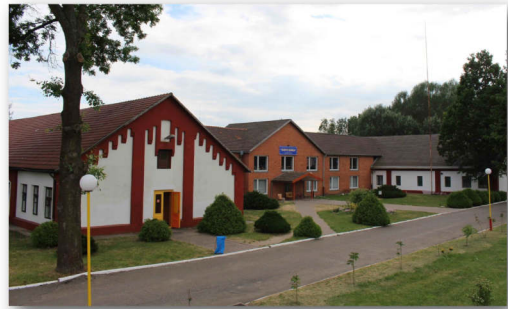
"Lilla pärlan" - Belarusiska Baptistunionens lägergård utanför Kobrin, Belarus